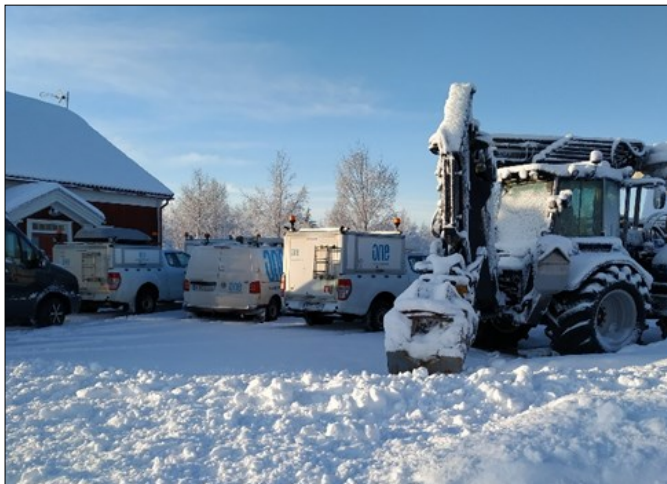
Ett resursstarkt gäng bor på Bygdegården

Från tidig vår och fortfarande, pågår arbeten med att säkra upp elleveranserna till Lögda by och angränsande byars elabonnenter. Bygdegården är uthyrd till entreprenör som utför arbeten med kabelgrävningar, nya elskåp och dragning av ny luftledning i anslutning till allmän väg. Ledning som ersätter den som tidigare dragits genom skog på sidan om vägar. Nu kommer bygdegården väl till pass med stora utrymmen till upplag för matriel och maskiner. En väl fungerande internetuppkoppling och säker elförsörjning är väl om något goda förutsättningar för ett tryggt boende och möjligheter att bedriva vissa verksamheter från byn i framtiden.