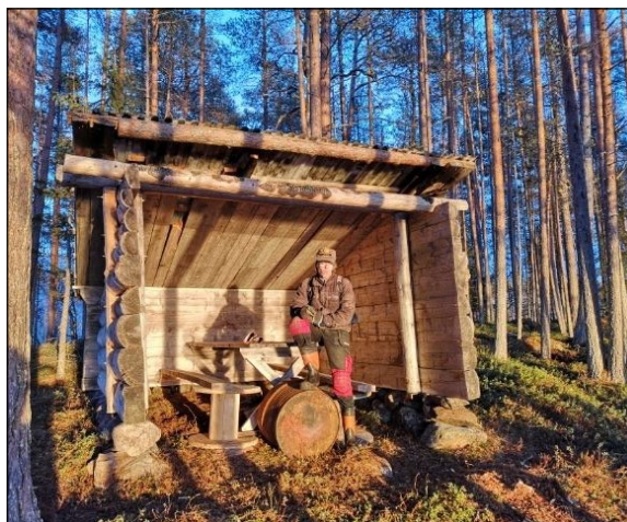
Martin Lundberg, Göran Dahlberg och Nils Lövgren har svarat för rivning, transport och uppsättning av vindskyddet.

Alla är väl informerade om konflikten mellan trafikverket och enskilda vägars intressen i Norrland, om samordning mellan allmänna och enskilda vägars snöröjning. För Lögdas del har vi lyckan av att ha en snöröjare som passerar byn för andra uppdrag i omgivningarna. Om så inte vore, skulle vi hamnat i ett bekymmersamt läge. Förhandlingar om en lösning av problemet pågår intensivt. Ett hopp står till arbetsgruppen, där Riksförbundet enskilda vägar och Trafikverket ska arbeta fram långsiktiga lösningar för vinterunderhåll av enskilda vägnätet.