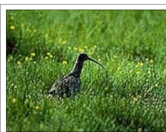
Vad är detta för fågel? Vi vill även ha det latinska namnet