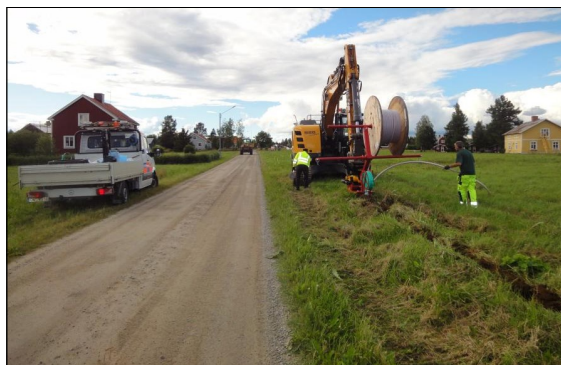
Grävningsarbete för nedläggning av fiber