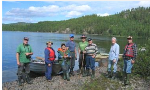
Deltagarna samlade vid en paus under båtturen

Kursen "Kulturdokumentation" i Lögda avslutades med båttur på den 1,5 mil långa Lögdasjön. Målet och tidpunkten blev en fullträff. Lögdasjön visade sitt allra vackraste ansikte. Blank som en spegel och behaglig värme och